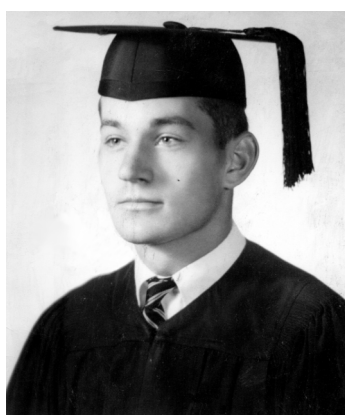
Новоиспечённый бакалавр наук Нью-Йоркского университета, 1957 г.

В 1955 году вся семья проводила двухмесячный отпуск в СССР, и я впервые оказался в России. В момент приезда мои родители считали, что я остаюсь в Советском Союзе и продолжу учёбу в Московском университете, по реалии российской жизни, разговоры с друзьями и родственниками, только что освобождёнными из сталинских лагерей, заставили их передумать.