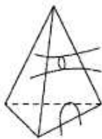
Рис. 2. Запрещённые пересечения