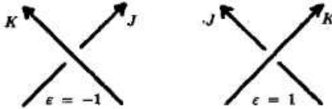
Рис. 1. Коэффициент зацепления